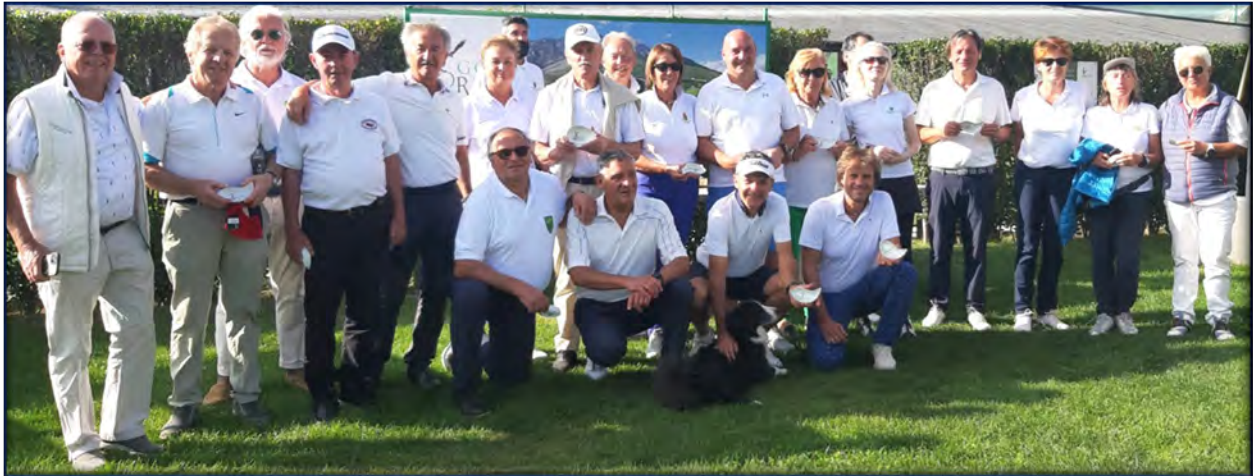
Sopra la Squadra dei giocatori rappresentanti dei Circoli Valtellinesi – Sotto i risultati della sfida 2023