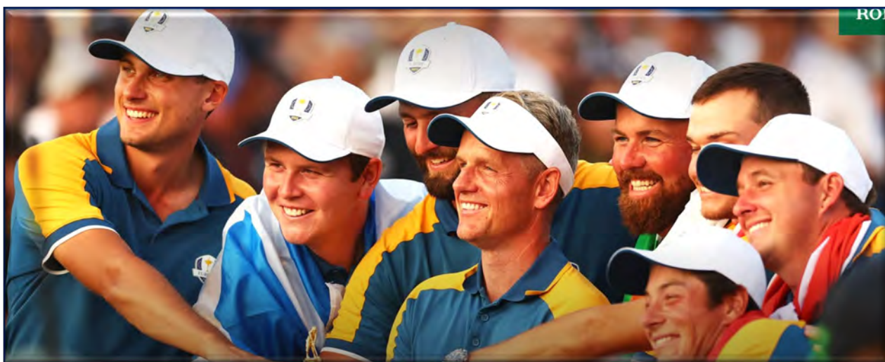
Il Capitano Luke Donald e i giocatori europei raggianti con la Ryder Cup appena conquistata