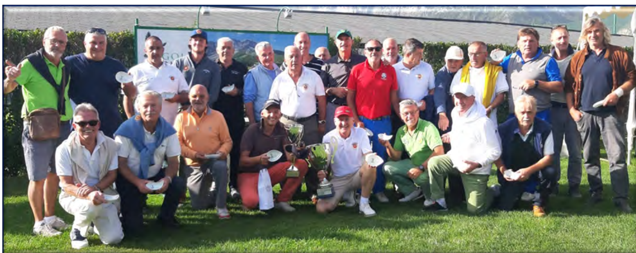
La Squadra di Menaggio vincitrice della sfida 2023, complimenti ... !!!

Iniziative come questa che richiamano sani campanilismi ereditati dal tempo, cementano amicizie e sono un valore per tutti i partecipanti.