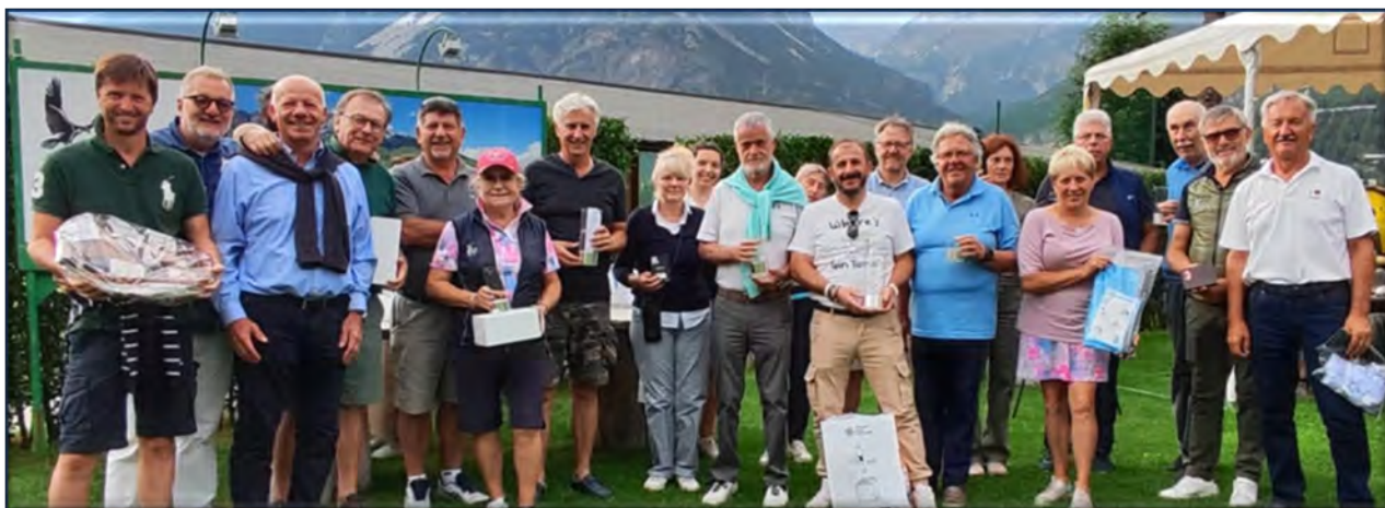
Foto di gruppo dei premiati della Louisiana della "MAGNIFICA TERRA"