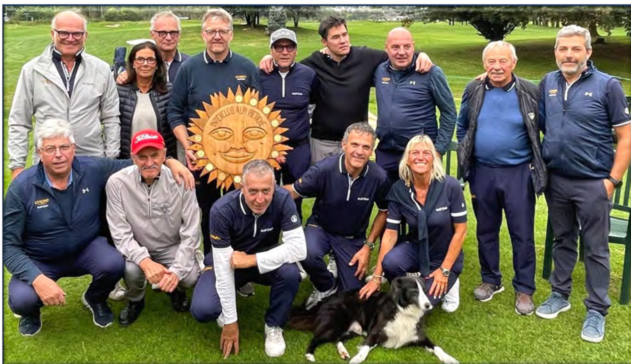
La squadra di Livigno con il trofeo di nuovo vinto nel 2024

Per cui ci appelliamo fin d'ora a tutti di programmare anche la partecipazione non solo alla gara di Bormio.