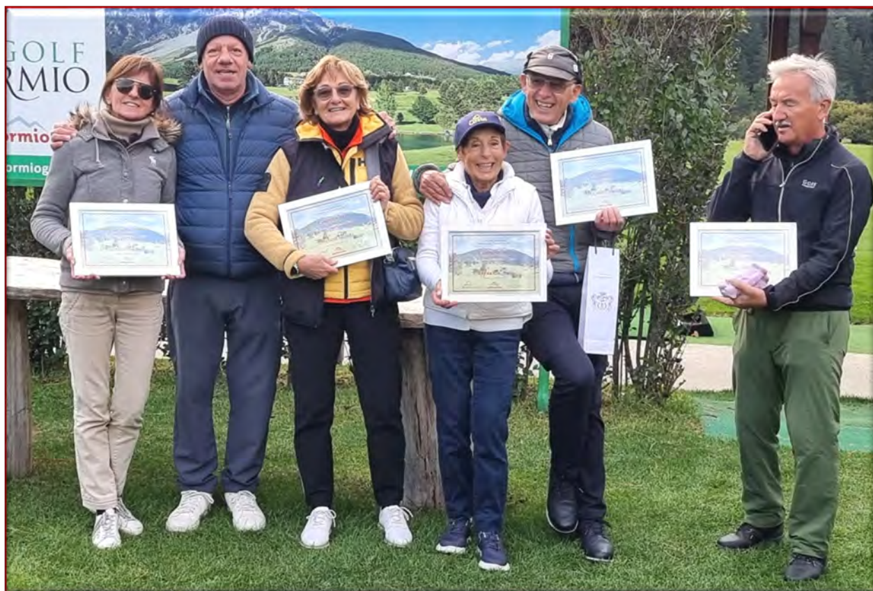
Foto di gruppo dei premiati presenti con il Presidente Filippo Abbà, qualcuno un po' distratto ... !!!